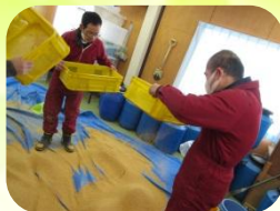
ほかし 製造・販売 (就労B)

9:00 登所・着替え 9:20 朝の会 9:30 作業 12:00 給食 13:15 作業 15:25 清掃・着替え 15:40 帰りの会