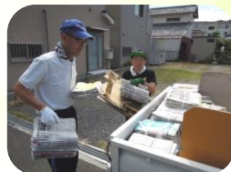
請負作業 (生活介護)